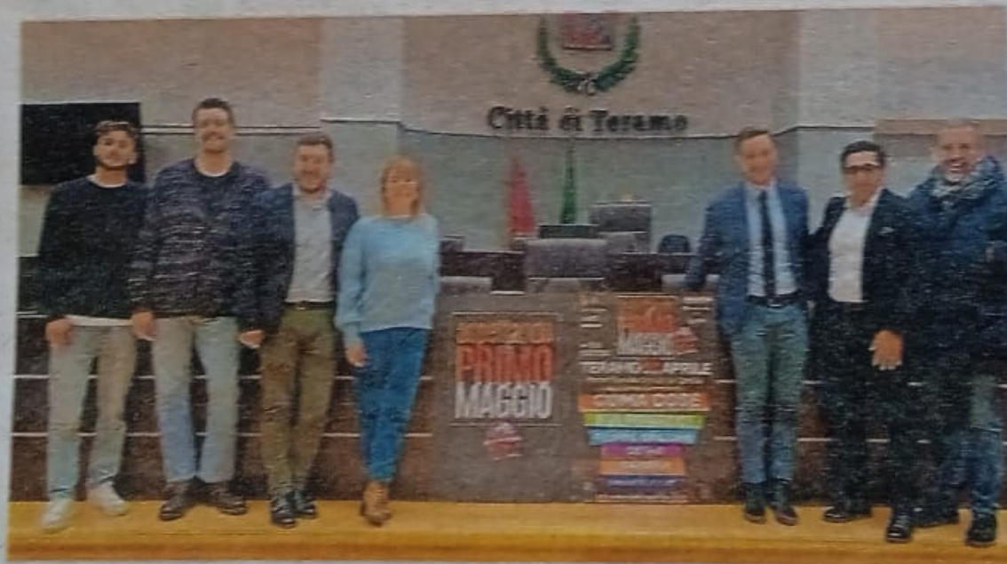
La conferenza di presentazione di "Aspettando il 1° maggio"