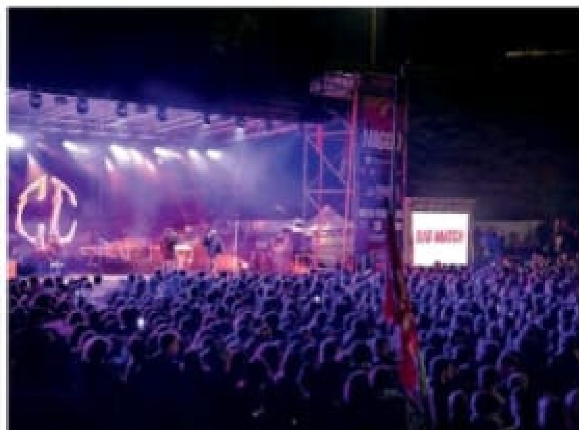
Il pubblico al concerto “Aspettando il Primo maggio”

“Aspettando il Primo maggio” dell’associazione Big Match ha fatto registrare il tutto esaurito