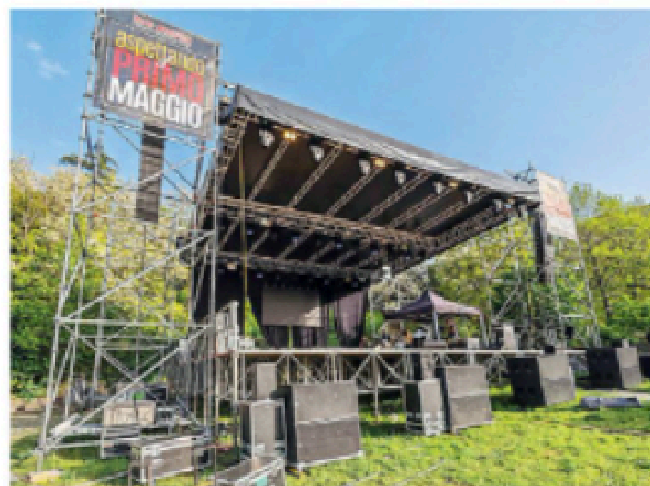
Il palco per il concertone nel parco fluviale del Vezzola (Marcocci)

Alle 17 l'apertura dei varchi di accesso all'area del parco fluviale, capienza limitata a 5mila spettatori. Dal pomeriggio c'è la tariffa scontata per la sosta nei mega parcheggi San Francesco e San Gabriele