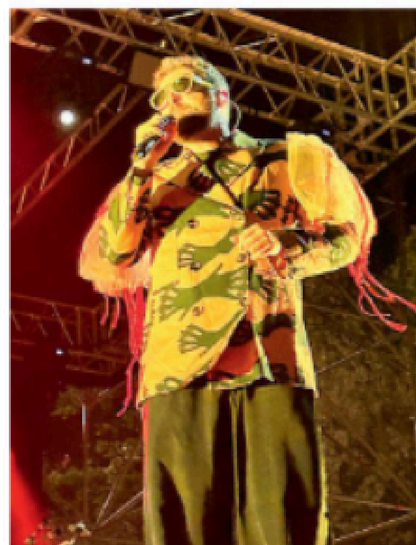
Il pubblico che ha affollato il parco fluviale. A destra Dargen D'Amico e sotto i Ken La Fen

stampa hanno avuto l'accesso da via Fonte della Noce. Servizio d'ordine capillare garantito da una massiccia presenza di tutte le forze dell'ordine.